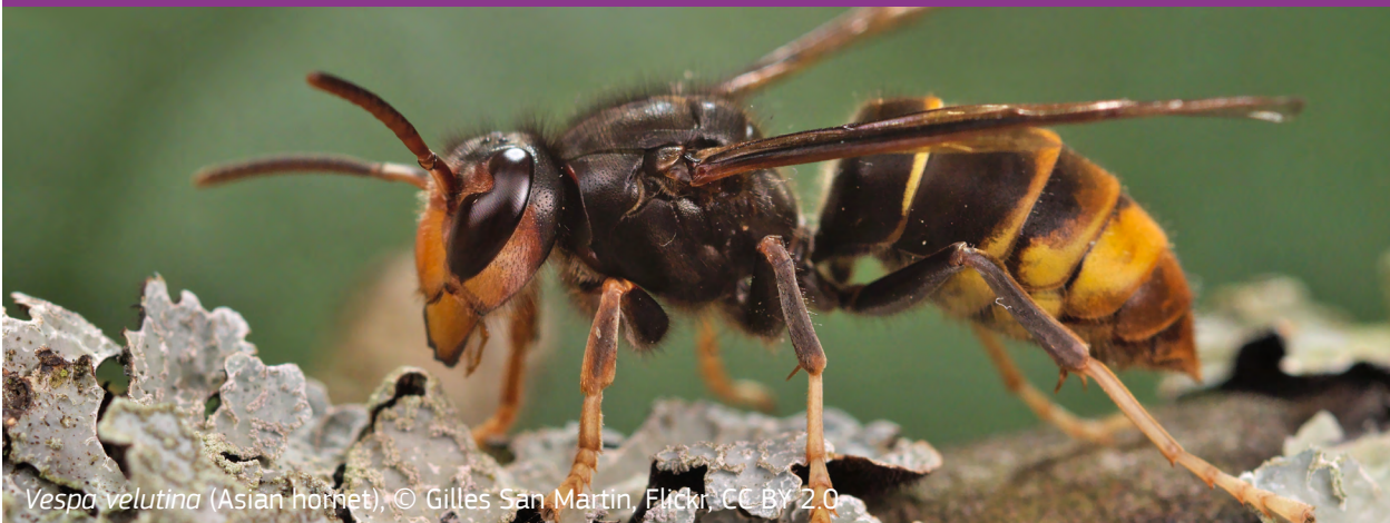
Vespa velutina (Asian hornet).

La lutte contre le frelon asiatique est l'un des sujets qui touche différents domaines de la stratégie locale de Vitoria-Gasteiz en matière de biodiversité. Le frelon asiatique a été introduit dans la région par Bordeaux (France) il y a cinq ans. Depuis, en raison de sa nature agressive et adaptable, il est devenu une menace pour les populations locales de pollinisateurs, en particulier les abeilles mellifères. Les actions entreprises par la ville pour contrôler cet insecte nuisible se fondent sur deux étapes : 1) l'identification et la capture des reines en hibernation au début du printemps à l'aide d'appâts (financé par le gouvernement régional), et 2) l'élimination des nids une fois que la reine s'est installée et a formé une colonie (financé par la municipalité). Cette dernière étape est menée par les pompiers locaux (responsables de 90 % de la suppression des nids) avec l'aide de citoyens locaux. À travers un protocole d'urgence, les citoyens qui détectent (et identifient correctement) un nid de frelon asiatique sont censés avertir les pompiers qui procèdent alors à son élimination. Malgré ces efforts et leur réussite relative, l'ensemble du processus demeure coûteux. Par conséquent, des nouvelles mesures complémentaires doivent être trouvées pour éradiquer l'espèce envahissante de frelon asiatique.