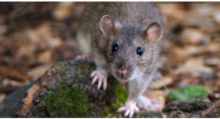
Figure 1. Les impacts environnemental et socio-économique des EEE.

Rattus norvegicus (rat d'égout) © Jean-Jacques Boujot CC by-sa Flickr. Le rat d'égout, accompagné d'autres espèces de rats, a été introduit dans le monde entier essentiellement en tant que passager clandestin sur les bateaux. Il est à l'origine, directe ou indirecte, de l'extinction de mammifères, d'oiseaux, de reptiles et d'invertébrés indigènes, en particulier sur les îles à travers la prédation. Il peut transporter des maladies et les transmettre aux humains, ronger les cultures vivrières et ravager les entrepôts alimentaires humains.