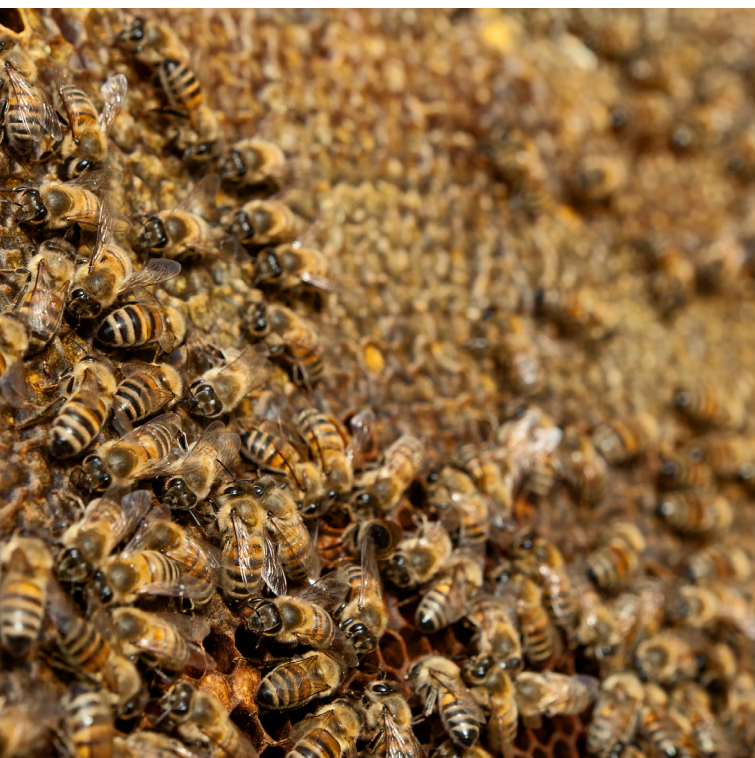
Apis mellifera

En termes de localisation de nids, le suivi visuel requiert du personnel, tandis que les coûts d'équipement sont négligeables. Les méthodes technologiques permettent potentiellement une réduction du temps nécessaire pour détecter des nids (ce qui augmente les probabilités de détection avant la phase de reproduction de la colonie), mais sont plus coûteuses en termes d'équipement. Le personnel préalablement formé et la disponibilité d'équipements dans un État membre (par ex. radar harmonique en Italie, suivi radio au Royaume-Uni) favorisent une utilisation efficace des ressources disponibles. En termes de destruction de nids, les ressources nécessaires comprennent du personnel formé et, le cas échéant, du dioxyde de carbone et des pesticides.