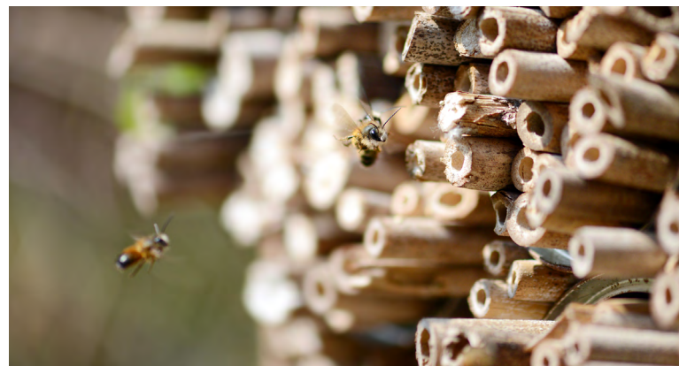
Osmia bicornis

Des ressources seraient nécessaires pour faciliter l'implication de toutes les parties prenantes du secteur horticole, afin de développer le Code de conduite, ainsi que sa stratégie de mise en œuvre, de contrôle et d'évaluation.