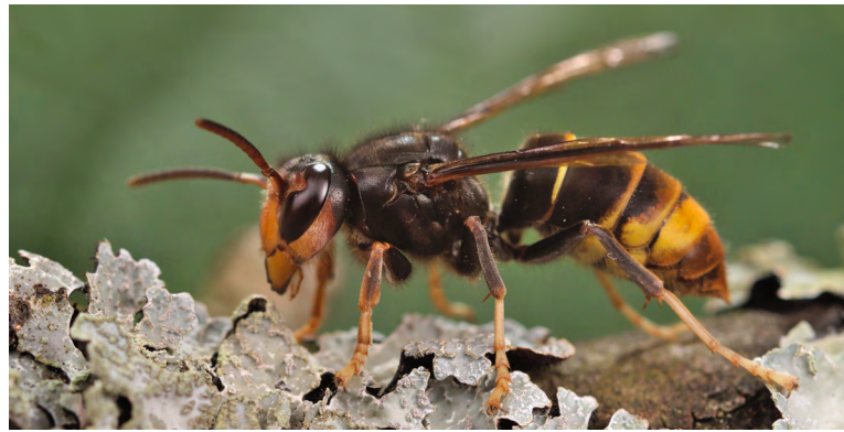
Vespa velutina (frelon asiatique)