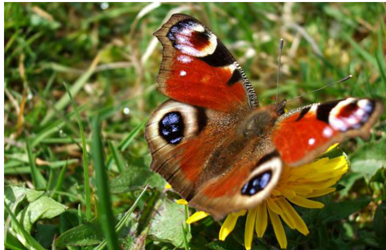
Aglais io (Peacock Butterfly)

Les pollinisateurs constituent une part étendue et diversifiée de notre biodiversité. Sans services de pollinisation, un grand nombre de fruits, fruits à coque et légumes disparaîtraient de notre alimentation, de même que beaucoup d'autres aliments et matières, telles que les huiles végétales, le coton et le lin. Outre ces avantages d'ordre matériel, la société bénéficie, à différents niveaux, directement ou indirectement des services des pollinisateurs et de leur influence sur la qualité de l'écosystème, y compris notre santé et notre bien-être, nos activités sportives et loisirs, l'éducation, le tourisme et la culture.