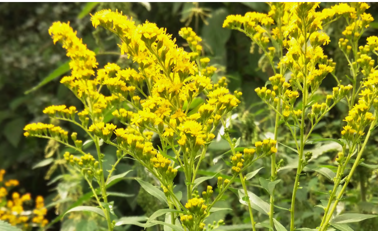
Solidago canadensis (verges d'or)