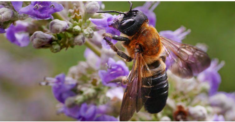
Megachile sculpturalis (abeille résinière géante)