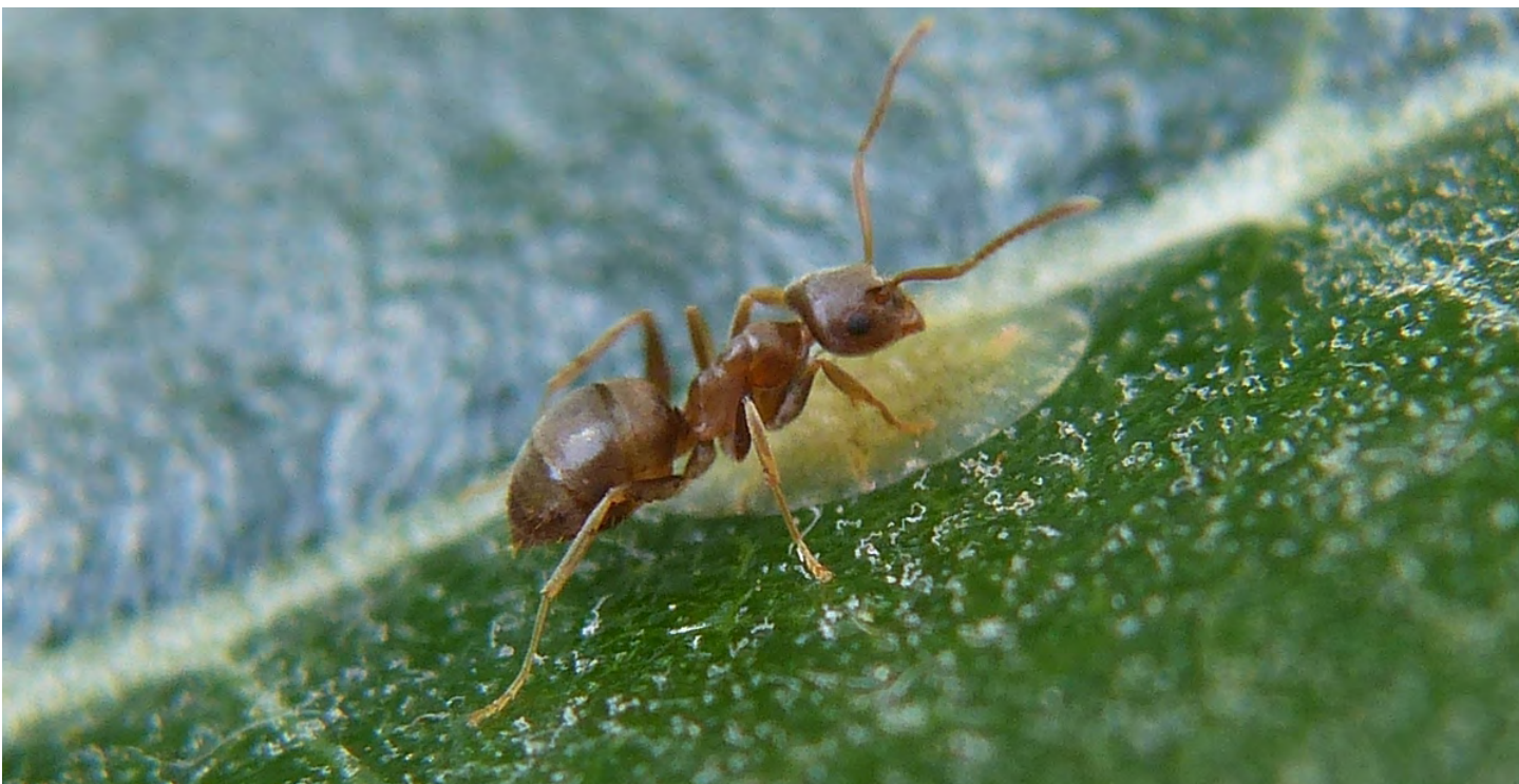
Lasius neglectus © Phillip Buckham-Bonnett

Les dépenses relatives à cette mesure sont associées au coût d'achat des produits chimiques nécessaires, à la formation du personnel et à la rétribution du personnel pour leur application.