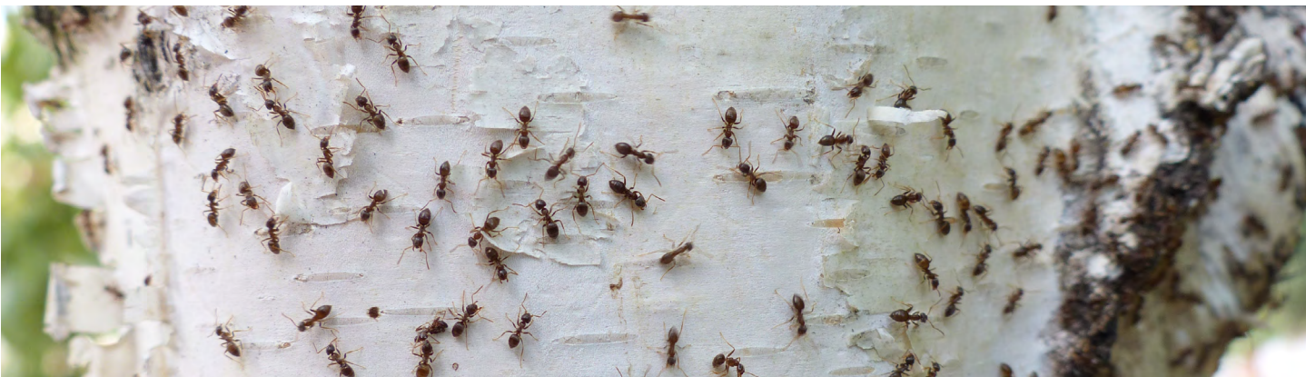
Lasius neglectus