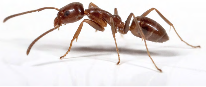
Linepithema humile (fourmi d'Argentine)