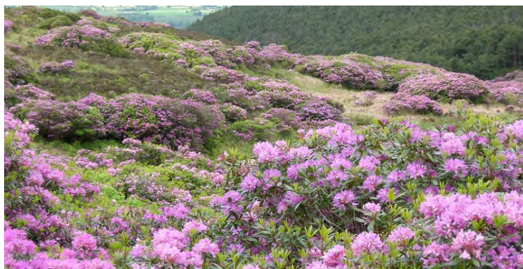
Rhododendron ponticum (rhododendron commun)